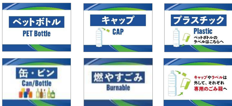
※分別表示イメージ